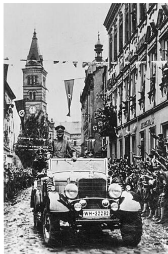
Hitler beim „Anschluss“ des „Sudetenlandes“ am 4. Oktober 1938 in Kraslice (2)

Vorausgegangen war dem eine massive Propagandaschlacht, die die deutsche Minderheit in der Tschechoslowakei für Hitlers Regime instrumentalisieren sollte. Die Sudetendeutsche Partei (SdP) näherte sich ab 1933 unter Führung von Konrad Henlein immer mehr dem Deutschen Reich an. Die tschechoslowakische Regierung musste die Gebiete nach den Münchner Verhandlungen, an denen sie nicht beteiligt wurde, schließlich abtreten, nachdem die Westmächte vor Hitler eingeknickt waren.