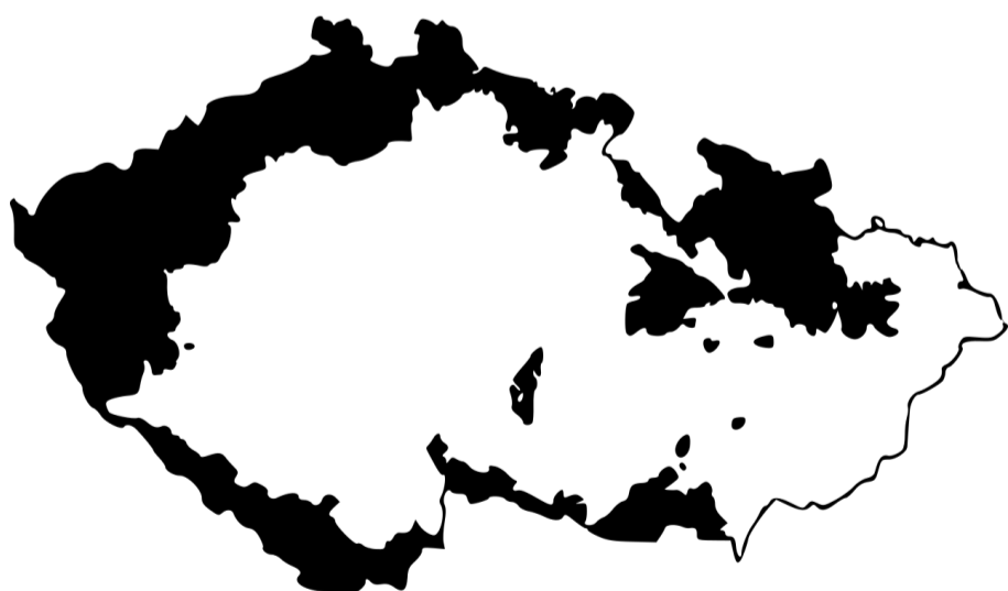
Karte der mehrheitlich deutschsprachigen Gebiete der Tschechoslowakei (1)