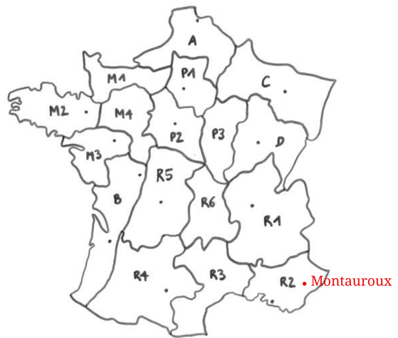
Carte de France montrant les réseaux de résistance selon le BCRA

Chaque nuit, lorsqu'un parachutage est prévu, la zone doit être balisée par des feux de bois afin de signaler son emplacement aux avions alliés volant dans l'obscurité. Les marchandises larguées