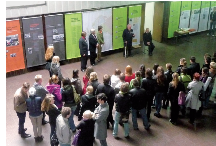
Nationale Universität für Architektur und Design in Kiew 2009

Alle Biographien im Gedächtnisbuch Dachau werden von ehrenamtlichen Teilnehmern recherchiert, verfasst und gestaltet. Durch ihr Engagement ermöglichen sie, die Geschichte eines ehemals Verfolgten wieder lebendig werden zu lassen, Spuren seines Lebens vor dem Vergessen zu bewahren. In relativ selbständiger Recherche sammeln die Teilnehmer Informationen über sein Schicksal, seine Familie und Freunde, seine Träume ... Dafür sind keine besonderen historischen Vorkenntnisse nötig, erwartet werden jedoch die Bereitschaft, sich auf die Arbeitsweise des Projekts einzulassen, Verantwortungsbewusstsein und Durchhaltevermögen. Die Recherche wird mit Seminarangeboten, individuell und im Rahmen einer Werkstattgruppe begleitet.