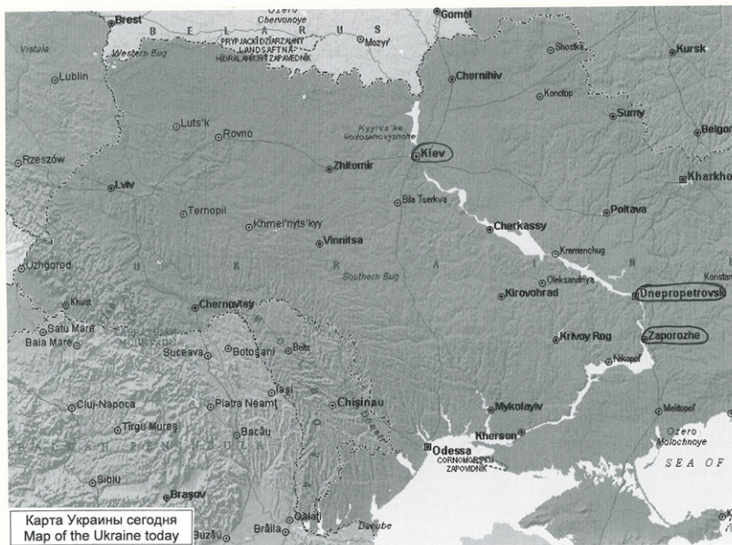
Карта Украины сегодня Map of the Ukraine today

— Personal conversation in Dachau, summer 2003