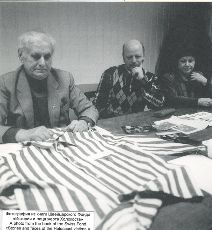
Фотография из книги Швейцарского Фонда «Истории и лица жертв Холокоста» A photo from the book of the Swiss Fond «Stories and faces of the Holocaust victims»