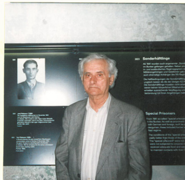
При посещении бункера в Музее-Мемориале Дахау, в 2003 г. Visiting the Bunker, part of Dachau's International Memorial Site, in 2003